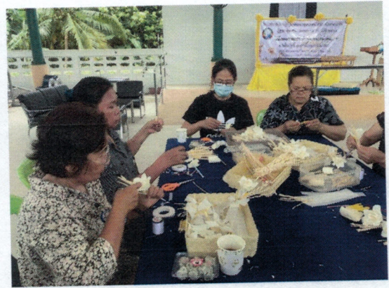
โครงการสนับสนุนศูนย์พัฒนาคุณภาพชีวิตและส่งเสริมอาชีพผู้สูงอายุ