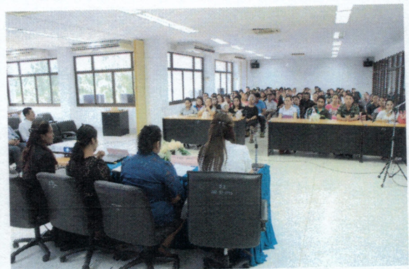
การประชุมผู้ปกครองศูนย์พัฒนาเด็กเล็กเทศบาลตำบลวังไผ่ ภาคเรียนที่ 1 และ ภาคเรียนที่ 2 ประจำปีการศึกษา 2560