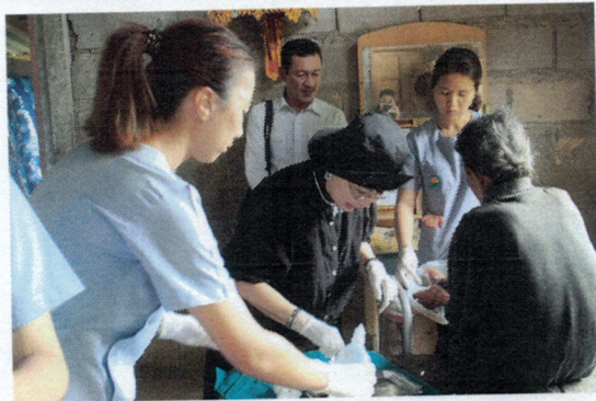
การให้บริการด้านสาธารณสุขของศูนย์บริการสาธารณสุขเทศบาลตำบลวังไผ่