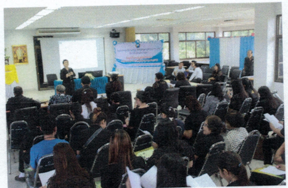
โครงการอบรมให้ความรู้ปลูกจิตสำนึกในการป้องกันการทุจริต