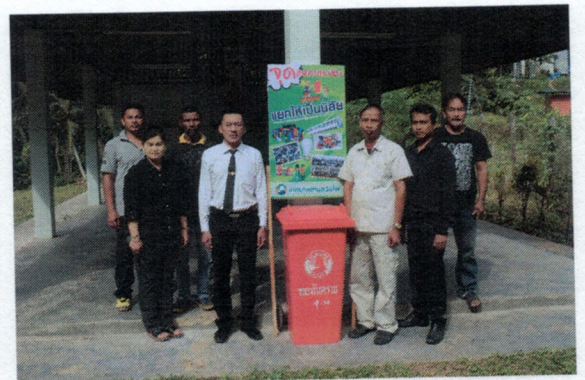
ตั้งจุดแยกขยะมีพิษในชุมชนต่างๆ