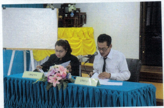
โครงการสนับสนุนการมีส่วนร่วมของประชาชนในการจัดทำเวทีประชาคมเพื่อจัดทำแผนพัฒนาท้องถิ่น