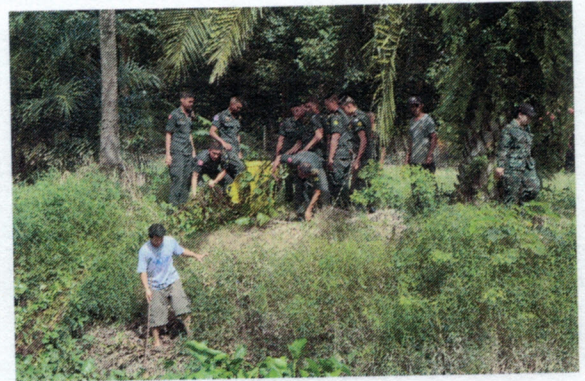
โครงการปลูกจิตสำนึกด้านสิ่งแวดล้อมให้แก่เด็กและเยาวชนในเขตเทศบาลตำบลวังไผ่