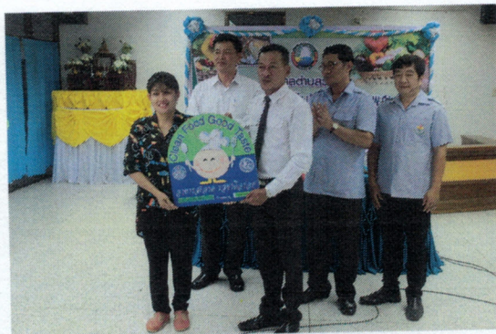
โครงการวิ่งเฝ้าอาหารปลอดภัย