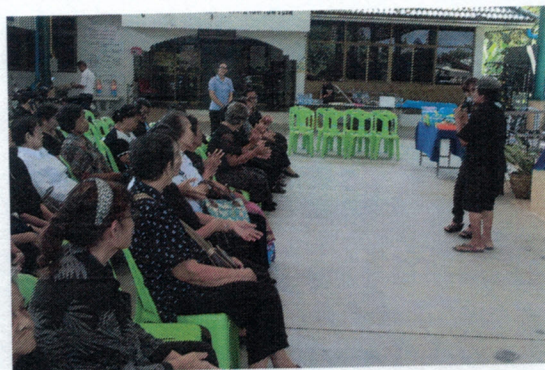
โครงการดูแลผู้สูงอายุแบบองค์รวม