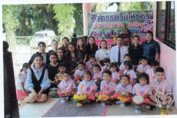
โครงการสนับสนุนการจัดกิจกรรมของศูนย์พัฒนาเด็กเล็ก