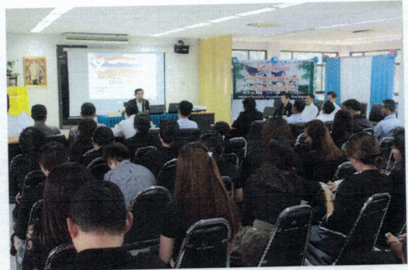
รับฟังการบรรยายเพื่อเผยแพร่ยุทธศาสตร์ชาติว่าด้วยการป้องกันและปราบปรามการทุจริต ระยะที่ 3 โดยสำนักงาน ป.ป.ช. ประจำจังหวัดชุมพร