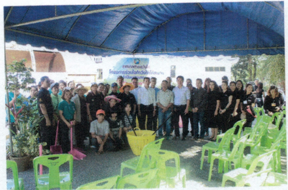
โครงการร่วมใจทำวังไผ่ให้สะอาด