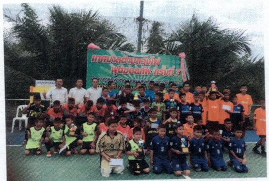
กิจกรรมเทศบาลตำบลวังไผ่ฟุตบอลคัพ ครั้งที่ 7 ในโครงการกีฬาต่อต้านยาเสพติด